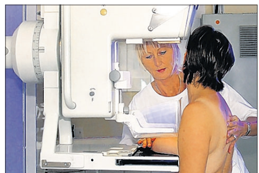
Bei der Mammographie wird die Brust geröntgt. So können kleinste Knötchen erkannt werden.